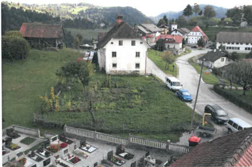
Župnišče z vrtom.

Podrobna raziskava stavbne zgodovine, še ni bila narejena. Današnja podoba župnišča izhaja iz konca 19. stoletja. Lokacija stavbe na mestu današnjega župnišča je razvidna že iz vojaške karte v drugi polovici 18. stoletja, natančneje pa je označena v Franciscejskem katastru, sredi prve polovice 19. stoletja, kjer hleva in svinjakov še ni bilo.